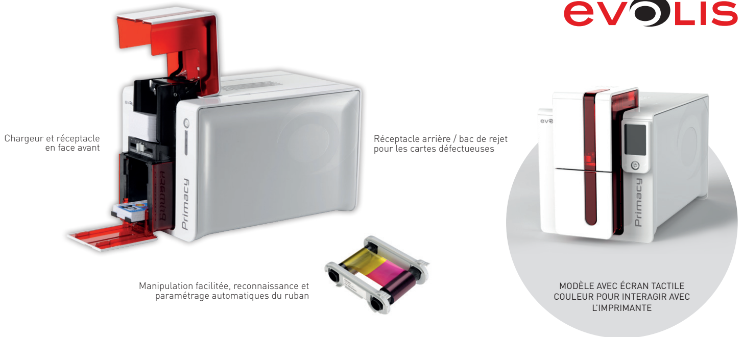
Chargeur et réceptacle en face avant